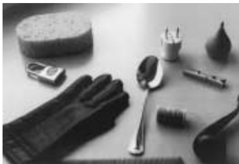
Figura 1. Ejemplos de objetos familiares utilizados en los estudios de memoria implícita y explícita, intermodal e intramodal

facilitación cuando ese mismo objeto fuera presentado a la otra modalidad (v.g., tacto) durante la fase de prueba de memoria. Para poner a prueba esta hipótesis utilizamos objetos familiares (ver Figura 1), en vez de palabras o formas no familiares, por varias razones. Primero, existe notable solapamiento entre la información subyacente a la percepción del objeto de forma visual o háptica. Segundo, los objetos reales pueden reconocerse con elevado grado de precisión a través de claves estructurales. Tercero, tanto el sistema visual como el tacto activo son muy eficientes cuando tienen que interactuar con objetos tridimensionales (Ballesteros, 1994; Ballesteros, Manga y Reales, 1997; Klatzky, Lederman y Metzger, 1985). Finalmente, los objetos reales son ecológicamente válidos, cosa que no ocurre con las formas y objetos no familiares.