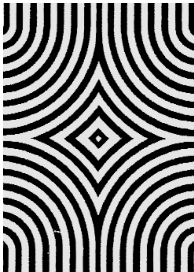
Figura 1. Ejemplo de los estímulos utilizados en el experimento. A la izquierda figura la diana y a su derecha el distractor. De arriba a abajo: estímulo decorativo figurativo y decorativo abstracto