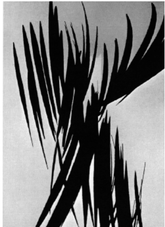
Figura 1. Ejemplo de los estímulos utilizados en el experimento. A la izquierda figura la diana y a su derecha el distractor. De arriba a abajo: estímulo artístico figurativo y artístico abstracto