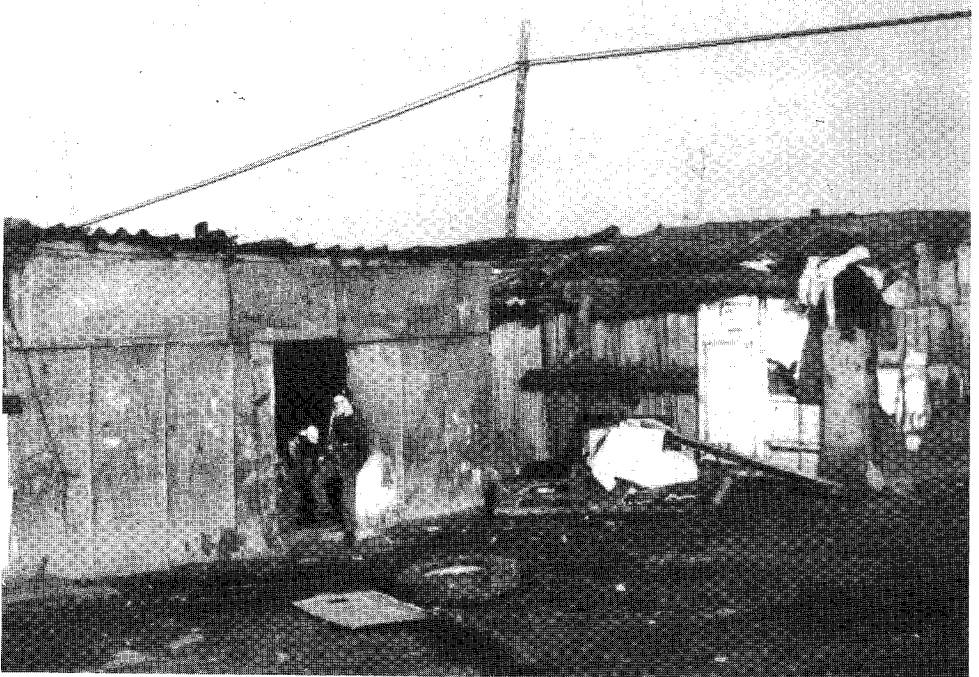
Figura 1. Chabola de Sierra de Granda en Siero. Poblado de gitanos donde se observa la situación inhumana de infravivienda.

Los objetivos generales de la investigación, en donde se encuadra la presentada en estas páginas, están referidos al estudio de diversos campos relacionados con el alojamiento de la población que vive en chabolas o infraviviendas (Figuras 1,2,3) situada en el área definida por el triángulo con vértices en Ribera de Arriba, Muros del Nalón y Gijón del Principado de Asturias.